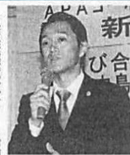
水溶性珪素「ウモ」の新データ発表 APAコーポレーション 水溶性珪素「ウモ」の新データ発表 水溶性珪素「ウモ」の新データ発表

水溶性珪素の原料メー カーであるAPAコーポ レーション(エーピー シー)の本社愛知県岡田 本社愛知県岡田 本社愛知県岡田 本社愛知県岡田